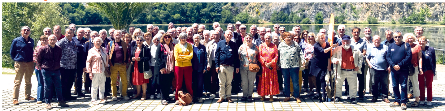
Un congrès sous un beau soleil

Le 6 juin dernier à Saint-Herblain, en présence d'une centaine de participantes et participants, l'Union Territoriale des CFDT Retraités 44 a tenu son 6 e congrès.