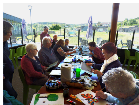
Initiation à l'aquarelle

Ce séjour agréable et le beau temps nous ont permis de faire connaissance d'autres retraités de Nantes et d'un pays que la plupart ne connaissait pas. Les questionnaires d'évaluation disent la satisfaction de tous d'avoir participé à ce séjour plein de cordialité et de découvertes.