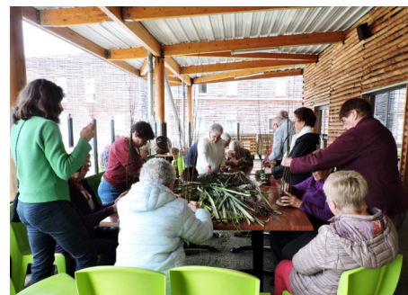
L'atelier de vannerie